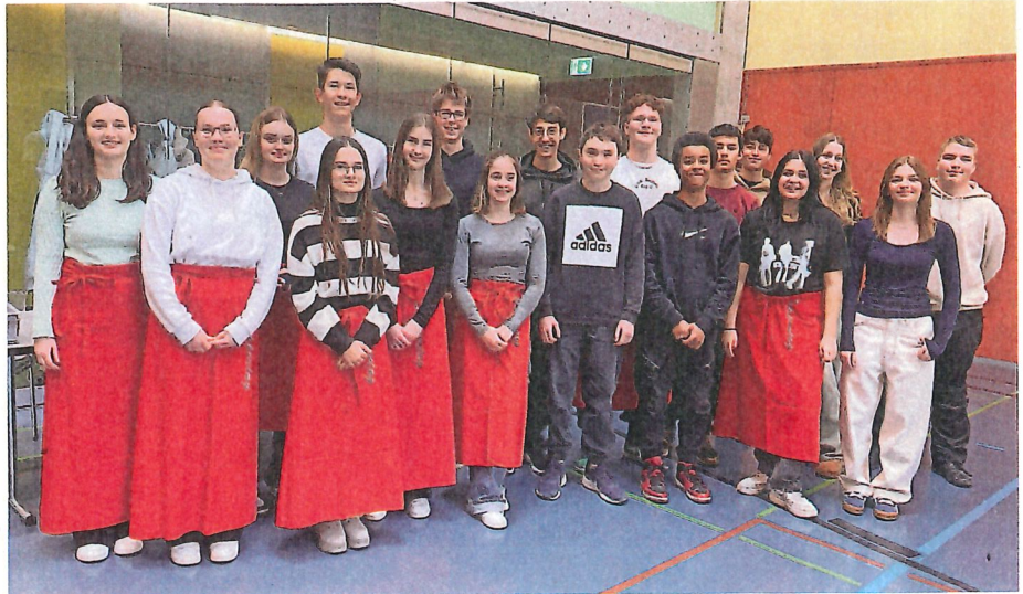
Konfirmanden und Firmlinge am Suppentag im Einsatz.